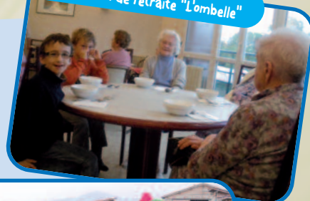
Réalisation de chocojats à la maison de retraite "Lombelle"

Pour plus d'informations adressez-vous à votre mairie ou connectez-vous au site www.limagne-bords-allier.org