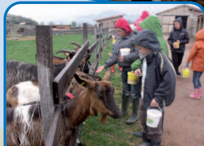
Sortie à la ferme de la Moulerette à Montpeyroux