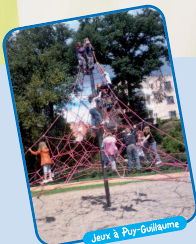
Jeux à Puy-Guillaume