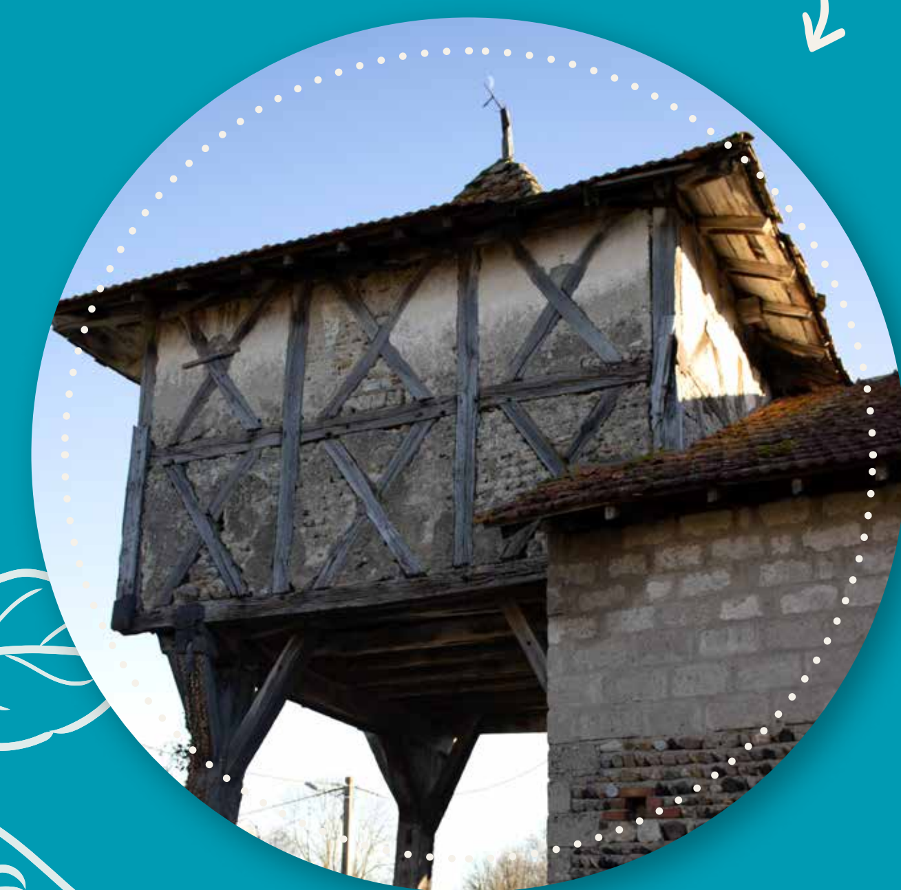
Pigeonnier de Vensat