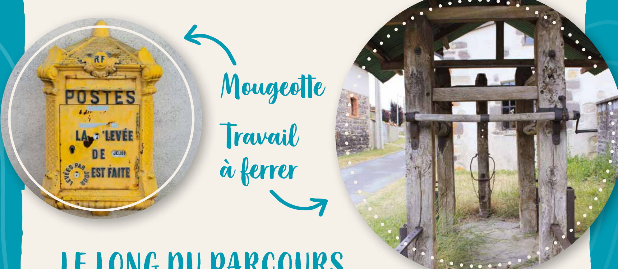
Mougeotte Travail à ferrer

Au XVI e s. , la renommée des foires de Maringues ont fait de la ville la seconde place commerciale de la basse Auvergne après Montferrand. Grâce à cet essor, la ville voit apparaître la classe bourgeoise qui s'installe et fait construire de belles demeures , encore visibles aujourd'hui. Maringues tire également sa notoriété du port de Vialle et de sa batellerie ainsi que du travail du cuir et de ses tanneries. Au XIX e s. , ces dernières étaient prospères : il existait, en 1880, une soixantaine de tanneries.