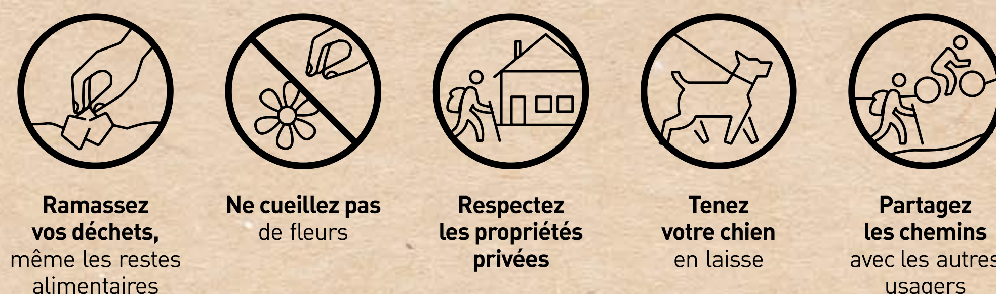
Ramassez vos déchets, même les restes alimentaires