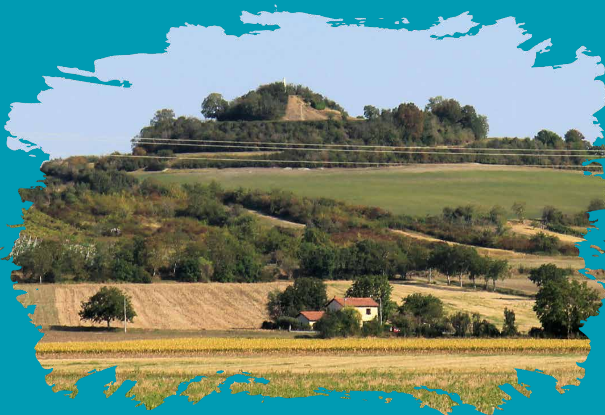
Butte de Montgacon

Ce circuit vous fera déambuler entre la Morge et la butte de Montgacon travers les villages traditionnels de la plaine. Il vous laissera apercevoir son histoire agricole, avec la présence d'éléments tels que des séchoirs à tabac , qui témoignent de cette activité marquante. Votre regard sera également attiré par les maisons familiales en pierre de Volvic dans lesquelles cohabitaient plusieurs générations. Vous passerez devant des lavoirs , des fours à pain ou encore des pigeonniers .